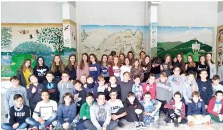
BRAVI Gli studenti della scuola media di Montignoso "Giorgini"

UN GIORNO, camminando al Pasquilio con i nostri familiari, abbiamo saputo che in quelle strade si tiene il Rally della Riviera. Il Rally, dall'inglese "raduno", è una disciplina sportiva dell'automobilismo che si svolge su strade pubbliche sia asfaltate che sterrate, utilizzando vetture da competizione derivate da modelli stradali. Per la precisione, si tratta di un misto fra gare di regolarità, visto che sui tratti di trasferimento le vetture devono rispettare il codice della strada, e gare di velocità a cronometro. Queste ultime, definite "speciali" sono quelle che il pubblico aspetta con ansia perché si svolgono su tratti di strada tortuosi, stretti e sconnessi, ovviamente chiusi al traffico, in cui piloti e navigatori devono dar prova delle loro abilità tecniche e del loro sangue freddo. Ogni macchina ha anche un proprio parco di assistenza, luogo in cui si effettua la manutenzione delle vetture. I percorsi di rally si trovano principalmente in collina e in montagna e le nostre alture apuane, in particolare il Monte Pasquilio, sono un ambien-